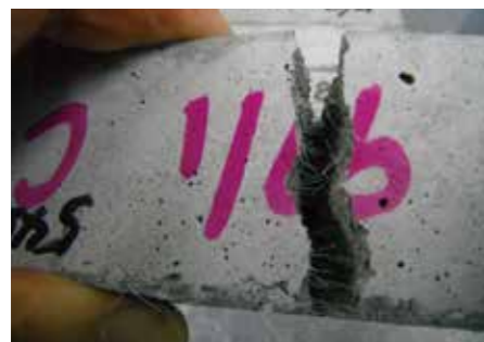
ビロニン短繊維が複雑に絡み合った断面